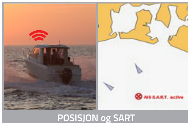
POSISJON og SART